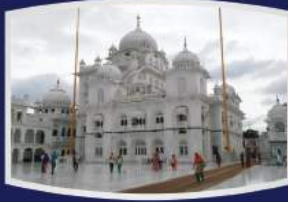
श्री पटना साहिब