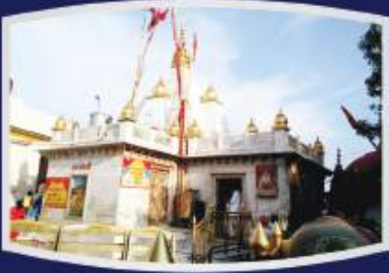
माता नैना देवी जी