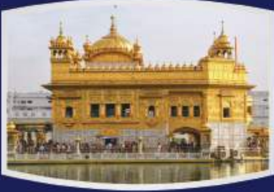
श्री अमृतसर साहिब