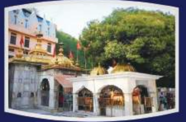
माता ज्वाला जी