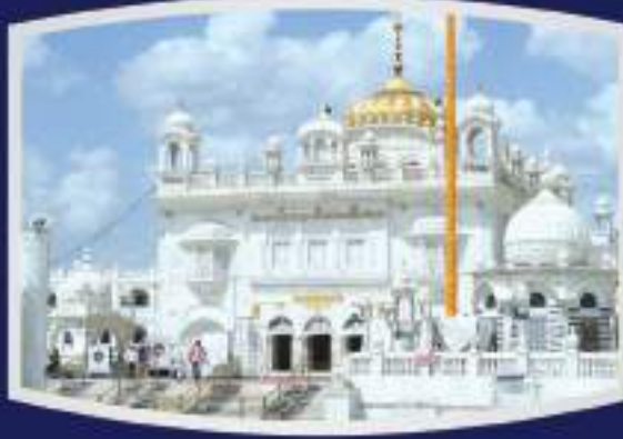
श्री हज़ूर साहिब