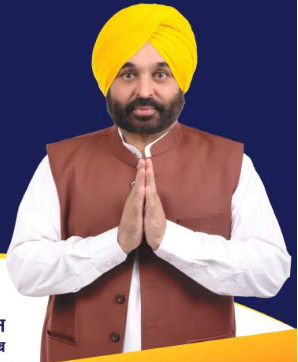
भगवंत सिंह मान मुख्य मंत्री, पंजाब