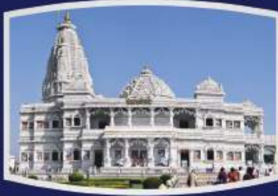
श्री वृंदावन धाम