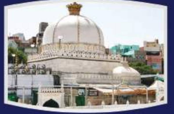
ख्वाजा अजमेर शरीफ दरगाह