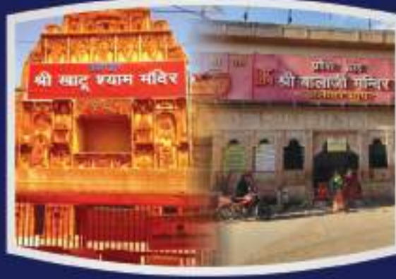
श्री खाटू श्याम जी, श्री सालासर धाम