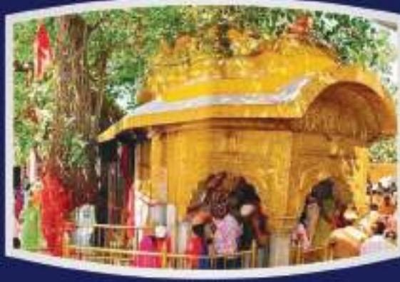
माता चिन्तपूर्णी जी