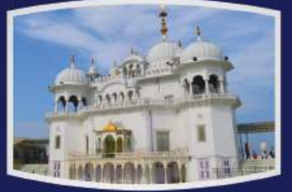
श्री आनंदपुर साहिब